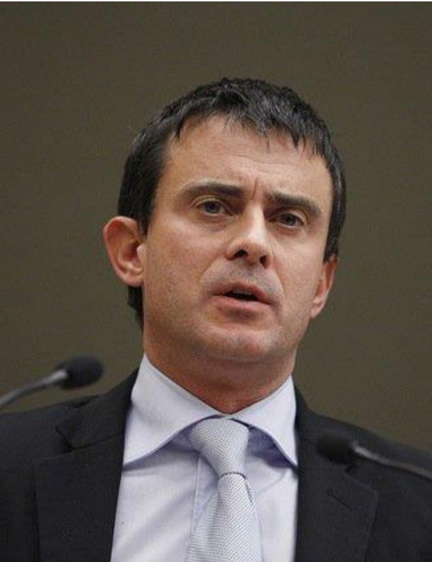
▶ Manuel Valls le 18 juin 2015